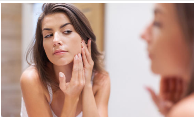
Prodotti per l'acne adulta