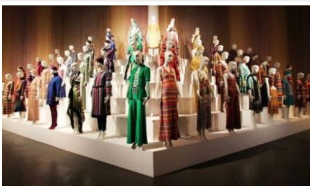
Quando la moda diventa arte