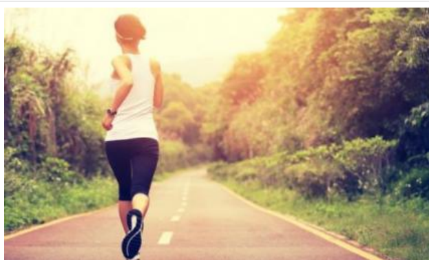
Quando hai fame corri più veloce