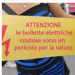
Abbassa la Bolletta della Luce

Bolletta della luce troppo Alta? Scopri come risparmiare il 75% oggi stesso (energysavingtips-blog.com)